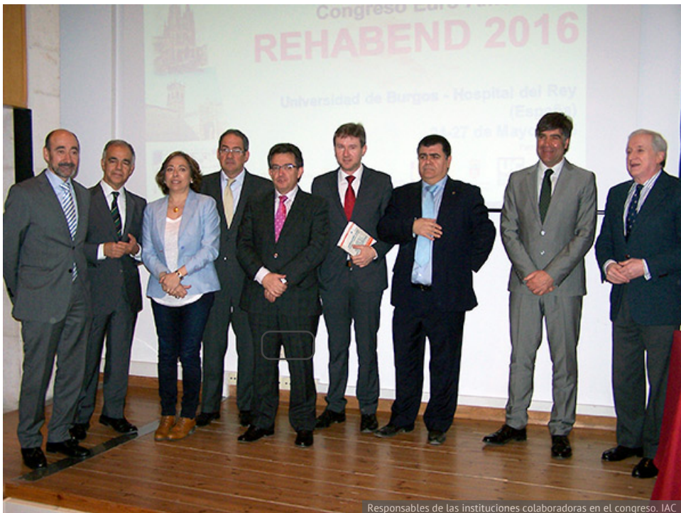
Responsables de las instituciones colaboradoras en el congreso. IAC